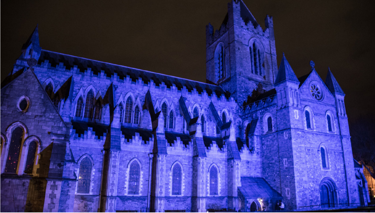
Ardeaglais Theampall Chríost, Baile Átha Cliath, Lá Fhéile Aindriú, 2019.