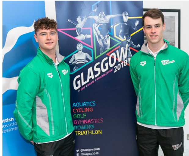
Freastalaíonn Cumann Snámha na hÉireann ar fháiltiú chun Craobhchomórtais na hEorpa 2018 a cheiliúradh.