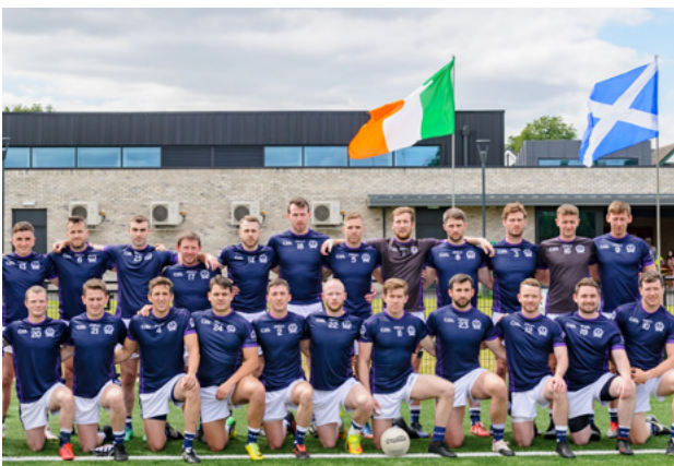
CLG na hAlban roimh an gCluiche Leathcheannais de Chraobhchomórtas Peil Sóisear na hÉireann 2019 in aghaidh Chiarraí ag Mol Pobail Spórt Clydebank, Glaschú.