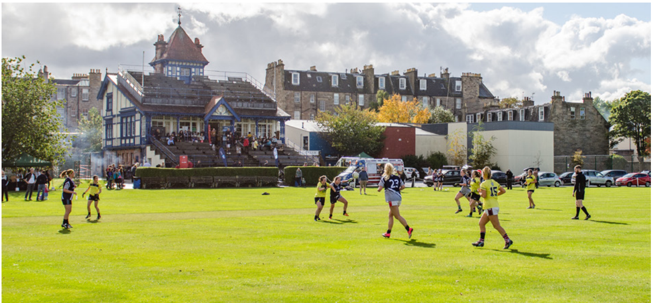
Cluiche Peile Gaelaí na mBan in ollscoil ag Lá Chultúr agus Oidhreachta na hÉireann 2017, Cumann Cruiceid na Gráinsí, Dún Éideann – arna óstáil ag Ard-Chonsalacht na hÉireann i nDún Éideann, Conradh na Gaeilge Glaschú, agus CLC na hAlban.