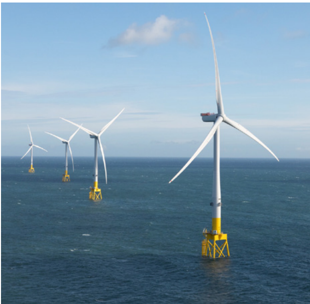
Aonad Forbartha na hEorpa don Ghaoth Amach ón gCósta, Obar Dheathain.

Is comhpháirtithe loighciúla iad Éire agus Albain mar gheall ar chomh gar atá siad dá chéile, an rochtain éasca, an teanga choiteann agus an tseantaithí chultúrtha, ach uaireanta bíonn siad ina n-iomaitheoirí ar son na gcúiseanna céanna freisin.