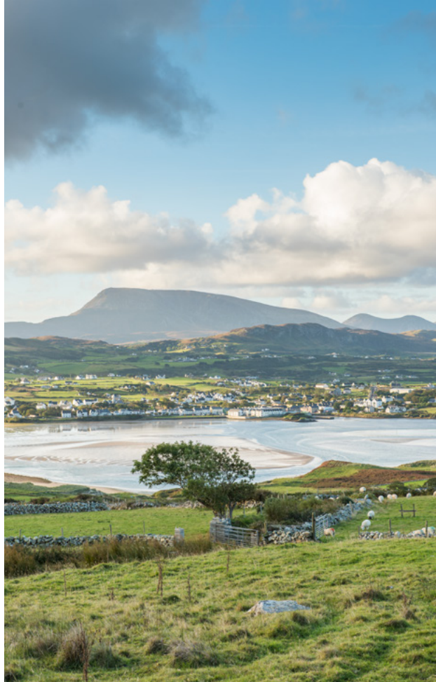
Dún Fionnachaidh, Contae Dhún na nGall.

Bhraith 73% de dhaoine a d'fhreagair an ceistneoir ar líne gurb é tíreolaíocht chomhroinnte phobail tuaithe, cois cósta agus oileán na hÉireann agus na hAlban an ceantar is láidre do chomhar, agus luadh é sa líon is mó tráchtanna. Tagann gach ceann de na téamaí eile athbhreithnithe le chéile i snáithe na bpobal Tuaithe, Cois Cósta agus Oileán, rud a chruthaíonn féidearthachtaí spleodracha le haghaidh comhair amach anseo.