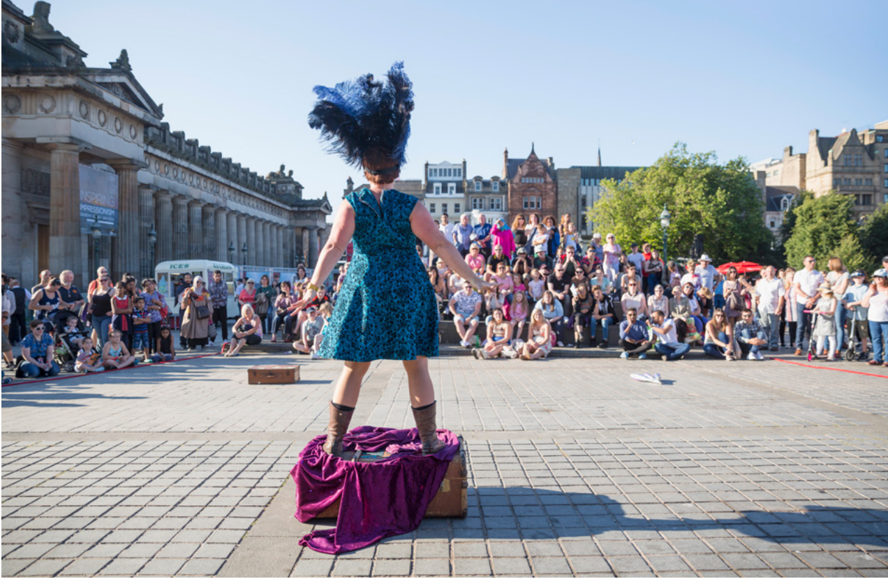
Taibhiú ar an Mound i nDún Éideann le linn Fhéile Imill Dhún Éideann.

idirnáisiúnta freisin. Tugann The Edinburgh Group comhlachtaí gairmiúla a dhéanann ionadaíocht ar ailtirí, innealtóirí agus suirbhéirí foirgneamh le chéile le hoifigigh Éireannacha agus de chuid na Ríochta Aontaithe agus rialtas déabhlóidithe go leathbhliantúil chun eolas ar oideachas agus cleachtas i gcaomhnú ailtireachta a mhalartú.