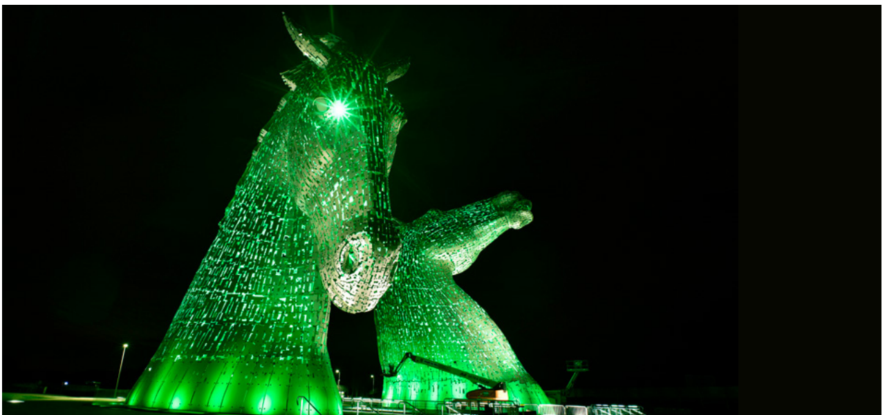
The Kelpies, Falkirk, atá mar chuid de thionscnamh Glasaithe Dhomhanda Thurasóireacht Éireann ar Lá Fhéile Pádraig, 2017.