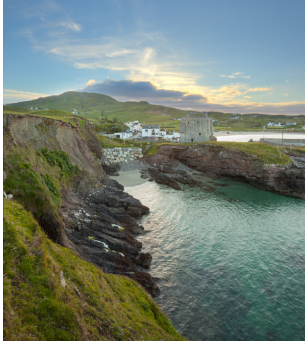
Cuan Chliara, Maigh Eo.