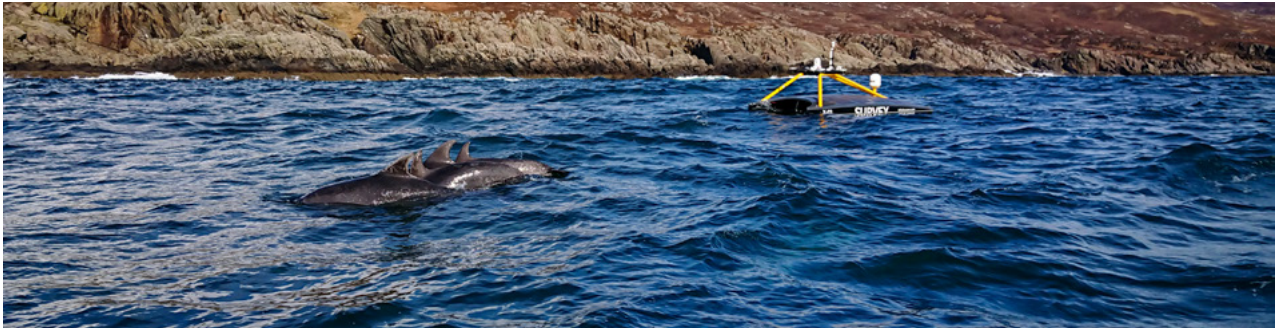
Soithí Barr Uisce gan Foireann de chuid XOCEAN agus iad ag feidhmiú amach ón Eilean Sgitheanach, Albain.

Cuireann XOCEAN seirbhísí bailiúcháin sonraí ar fáil do shuirbhéirí, cuideachtaí agus gníomhaireachtaí ag úsáid soithí barr uisce gan foireann (USV). Tá mapáil ghrinneall na farraige agus monatóireacht ar an gcomhshaol i measc na seirbhísí a chuireann XOCEAN ar fáil, táirgeann siad réiteach atá sábháilte, tíosach agus neodrach ó thaobh an charbóin de chun sonraí aigéin a bhailiú trína n-ardán, ag cinntiú gur féidir le náisiúin chósta, amhail Éire agus Albain, an acmhainn nádúrtha luachmhar seo a chosaint agus leas a bhaint aisti. Áirítear iniúchtaí ar phíblínte le haghaidh cuideachtaí amhail BP, Shell agus TOTAL agus suirbhéanna bataimeadracha ar chósta na hAlban do MCA (an Ghníomhaireacht Mhuirí agus Garda Cósta) san obair chósta a dhéanann XOCEAN in Albain.