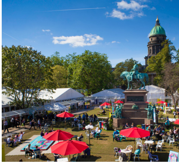
Féile Idirnáisiúnta Leabhar Dhún Éideann, Gairdíní Chearnóg Charlotte.

Tá ceangail láidre idir oifigigh agus airí sna tionscail chruthaitheacha freisin, agus san earnáil oibre 'Teangacha Dúchasacha, Mionlaigh agus Neamhfhorleathana' de chuid Chomhairle na Breataine-na hÉireann. Buaileann ár n-oifigigh le chéile uair amháin sa ráithe faoi chlár oibre débhlíantúil, roimh chruinniú na n-airí.