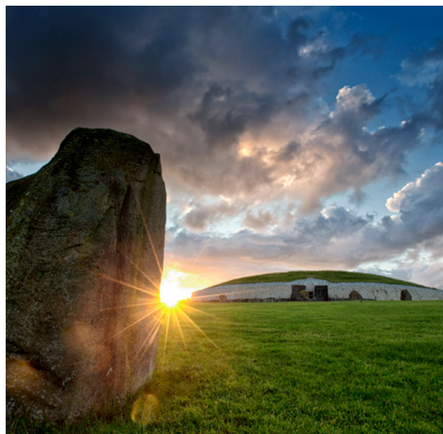
Sí an Bhrú – tuama pasáiste Neoiliteach atá mar chuid de Láithreán Oidhreachta Domhanda Bhrú na Bóinne.

Tá an bhallaíocht neamhfhoirmiúil agus tá na baill seo a leanas sa líonra faoi láthair: an Coláiste Ollscoile, Baile Átha Cliath; Ollscoil na nGarbhchríoch agus na nOileán; National Museums Scotland; Ard-Mhúsaem na hÉireann; Seirbhís na Séadchomharthaí Náisiúnta; an Roinn Tithíochta, Rialtais Áitiúil agus Oidhreachta; Historic Environment Scotland; Roinn Pobal Thuaisceart Éireann; Society of Antiquaries of Scotland; German Archaeology Institute; Northlight Heritage; agus Orkney Islands Council.