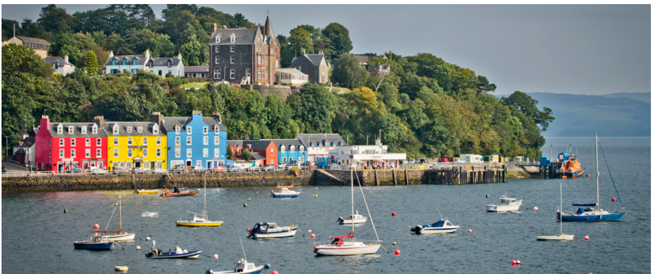
Tobermory, Oileán Mull.