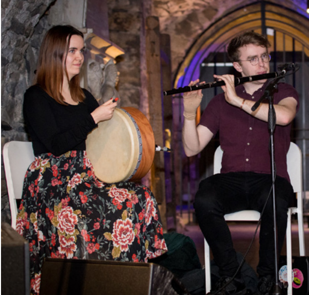
Ceoltóirí ó Live Music Now Scotland! agus iad ag taibhiú ag ócáid a d'óstáil Rialtas na hAlban ar Lá Fhéile Aindriú i mBaile Átha Cliath.

Tá meascán mearaí d'eagraíochtaí pobail seanbhunaithe le haghaidh mhuintir na hÉireann in Albain, ach ní raibh ach rannpháirtíocht teoranta ann le Clár Tacaíochtaí Imirceach Rialtas na hÉireann. Tugtar le fios sna tuairimí a cuireadh in iúl sa cheistneoir ar líne go mbeadh dúil ag daoine i níos mó rannpháirtíochta sna spóirt agus sna healaíona, ag léiriú go bhfuil todhchaí inbhuanaithe ann le haghaidh eagraíochtaí Éireannacha in Albain.