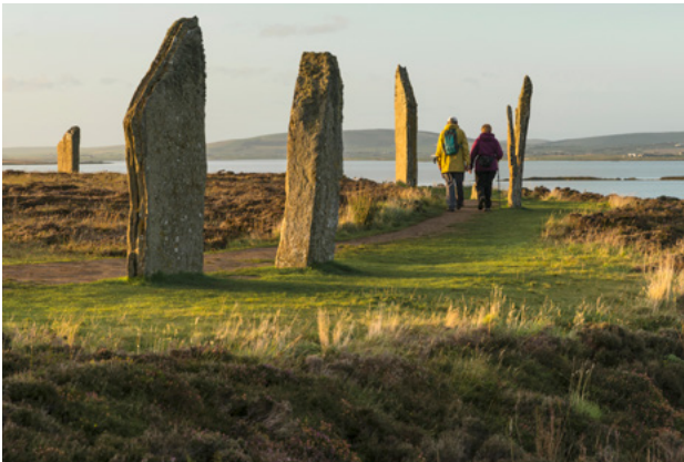
The Ring of Brodgar – cuid de Láithreán Oidhreachta Domhanda Heart of Neolithic Orkney.

Tá séadchomharthaí Neoiliteacha (ó thart ar 4000 BC go dtí 2500 BC) ina ngné shuntasach d'oidhreacht shaibhir chomhroinnte na hAlban agus na hÉireann. Tá breis agus 1,000 séadchomhartha atá ina seasamh ón tréimhse Neoiliteach in Albain agus in Éirinn, agus baineann tábhacht idirnáisiúnta le roinnt acu, mar Láithreáin Oidhreachta Domhanda san áireamh, ar a dtugann na mílte daoine cuairt gach bliain.