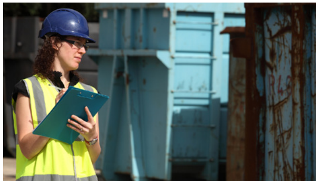
Mabbett, sainchomhairleoireacht sábháilteachta, chomhshaoil agus innealtóireachta Albanach.