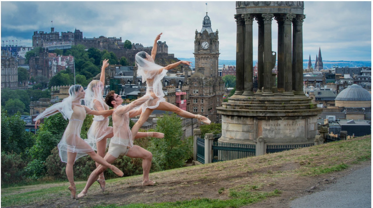
Bailé Éireann ag Féilte Dhún Éideann 2018, mar chuid de Chultúr Éireann BM18.

athbhreithnithe; reáchtáladh comhchainteanna, grúpaí comhairliúcháin agus na céadta comhráite le haghaidh na gcruinnithe sin. Bhíomar in ann cumhacht an athbhreithnithe a leathnú le ceistneoir ar líne. Fuarthas thart ar 1,068 freagra ó dhaoine aonair agus ó eagraíochtaí in Éirinn, in Albain agus níos faide i gcéin.