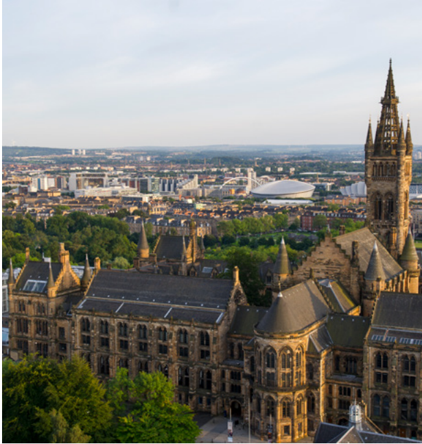
Príomhfhoirgneamh Ollscoil Ghlaschú. © Ollscoil Ghlaschú

Eascaíonn cultúr agus struchtúir chomhchosúla in earnáil an ardoideachais as an traidisiún comhroinnte. Tá sé sin ina chúis le comhar den scoth ag leibhéal acadúil, agus naisc tháirgiúla taighde. Tá Albain agus Éire i measc an 20 tír is fearr in Incites Essential Science Indicators 2019, agus tá tiomantas láidir acu don nuálaíocht agus do shochaithe eolasbhunaithe a fhorbairt atá in ann aghaidh a thabhairt ar dhúshláin náisiúnta agus dhomhanda.