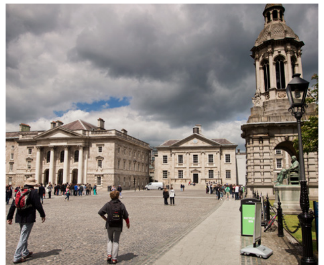
Coláiste na Tríonóide, Baile Átha Cliath.

Oibreoidh an dá rialtas le comhpháirtí ar fud na hearnála seo chun deiseanna a chruthú do thaighde a thacaíonn le gach téama sa tuarascáil seo a fhorbairt. Leanfaidh an dá rialtas ar aghaidh freisin ag cothú deiseanna le haghaidh comhar níos doimhne agus níos struchtúrtha idir institiúidí agus comhlachtaí taighde agus nuálaíochta.